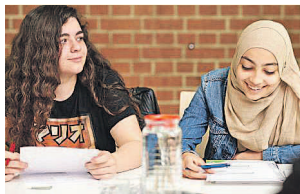
Gemeinsam lernen kann Spaß machen!

Gelernt wird vier Stunden pro Tag, die Kurse laufen jeweils vier Tage lang und kosten 30 bis 35 Euro insgesamt, davon entfallen 20 Euro auf den Kurs und 10 bis 15 Euro auf die Verpflegung. Die Anmeldung erfolgt persönlich bei der jeweiligen Freizeitstätte. Diese kann auch alle Fragen zum Lernkurs beantworten. In der ersten Ferienwoche, täglich von 10 bis 15 Uhr (Abweichungen sind angege-